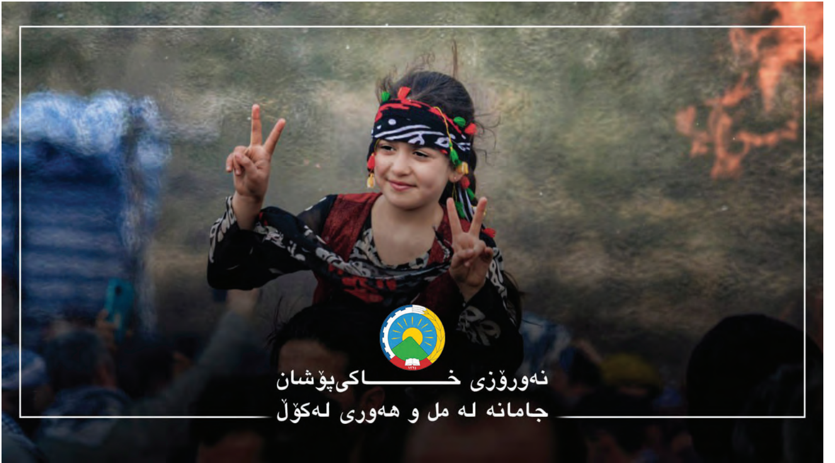
نهوړۆزی خاکی پۆشان جامانه له مل و ههوری له کۆل