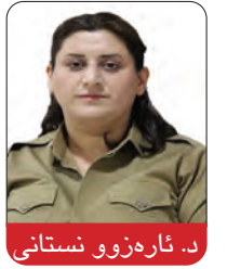
د. ئاره‌زوو نستانى

سەرەکی راپەرینه‌که دەرده‌که‌وی که بریتی بوو له ژن، ژیان، ئازادی.