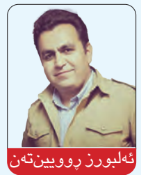
ئه‌لبورز پرووین ته‌ن

هه‌لبژاردن تاکه‌ پێداویستی دیموکراسی نییه، به‌ لاکو یه‌کیه‌ک له‌ ده‌یان پشیمه‌رج و پێداویستی و له‌ چوارچۆیه‌ی ریسای یاسای دیاریکراوی دیموکراتیکدا وه‌ک قونافی گرینگی دیموکراسیه‌کان ده‌بیندرا. ئه‌وه‌ی ئه‌مڕۆک نسیبه‌ت دیموکراسی و ولاتانی دیموکراتیکه‌ی سهرنجه‌ زیاتر له‌و هه‌لبژاردنه‌ی ریسای و ریسایش هه‌بوونی