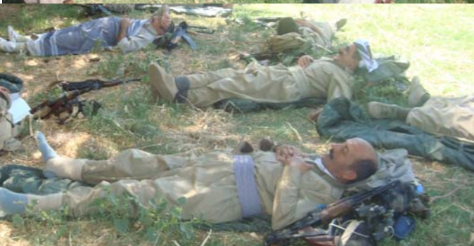
دهره‌ینه‌رو به‌شدارانی فیلمه‌که له‌کاتی وینه‌گرتنی "ملوانکه"

ژيانی شۆرشگێرانه، هه‌رموو. وه‌ک دوا و ته‌ی ئه‌م وتووێژه پێویسته‌ بلێم که سینه‌مای کوردی ژۆر ساوايه و له‌ داره‌داره‌ دايه، بۆ که‌وتنه‌ سه‌ر پێی و پێه‌لگرتنی پێویستی به‌ پشتگیری هه‌یه، حه‌ز ده‌که‌م لێره‌دا ئه‌و ته‌عریفی گۆدار له‌ سینه‌ما وه‌بیر بێنمه‌وه‌ که ده‌لێ: سینه‌ما ئه‌سه‌له‌یه‌که‌ که له‌هه‌ر چهرکه‌یه‌دا ۲۴ گولله‌ی لێ دهرده‌چێ. جا بۆیه‌ ده‌بێ سه‌رکرده‌کانی کورد ژۆر وشیار بن و پشتی سینه‌مایه‌ک بگرن که ئه‌و گوللانه‌ به‌ره‌وپووی خۆمان نه‌چرکێت، پشتی سینه‌مایه‌ک بگرن که رووی لولو‌یه‌ی ئه‌سه‌له‌یه‌که‌ی له‌ دۆزمنانی گه‌له‌که‌مانه‌، داواشم له‌ خه‌ک و ئۆگرانی فیلم و سینه‌مای پێشمه‌رگه‌و شۆرش ئه‌وه‌یه‌ که پشتیوانی له‌م سینه‌مایه‌ بکه‌ن، هه‌روه‌ها داوام له‌ نووسه‌ران، هونه‌رمه‌ندان و رووناکبیرانی گه‌له‌که‌مانه‌ که هاوکاری ئه‌م شێوه‌یه‌ له‌ خه‌بات بکه‌ن، وه‌رن‌با به‌ سینه‌ما سیاسه‌ت بکه‌ین به‌ سینه‌ما خۆمان به‌ جیهان بناسین چه‌ک و قه‌لم و هونه‌ر لێک دانه‌بپراو و گرێدراوی یه‌کتا بن.