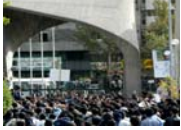
ره چه نه کناسیی بزوتنه وهی خویندکاری