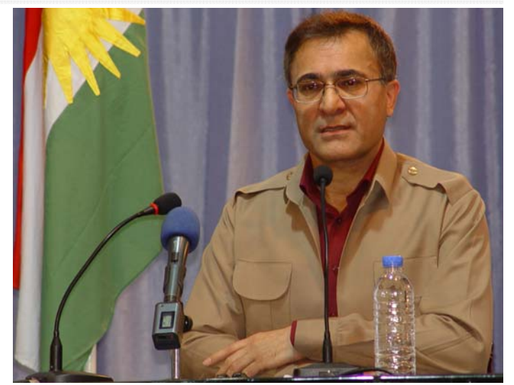
خوشک و برایانی خۆشه ویست، هاو پێانی حیزبی و هاو پێانی پیشمه رگه!

روژی ۲۶ی سه رماوهزی، روژی پیشمه رگه ئه ناوهی که له سه رده می کۆماری کوردستان بۆ دامه زانندی سوپای میلیسی کوردستان، هاته گۆڕی، پڕ به دل پیرۆزیایی له ئیوه و له هه مو هاو پێانی حیزبی و له هه مو خه لکی کوردستان ده کم . به تایبته جیبی خۆیه تی له و روژه دا پیرۆزیایی روژی پیشمه رگه له بنه ماله ی ده بیان و هه زاران پیشمه رگه ی کوردستان بکه ین که رۆله کانیان له ریگای رزگاریی کوردستان دا گیانیان به خت کردوه .