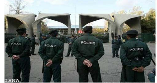
دانسگای تاران ۲۰۰۹

جهان سر به سر عبرت و حکمت است .... فردوسی