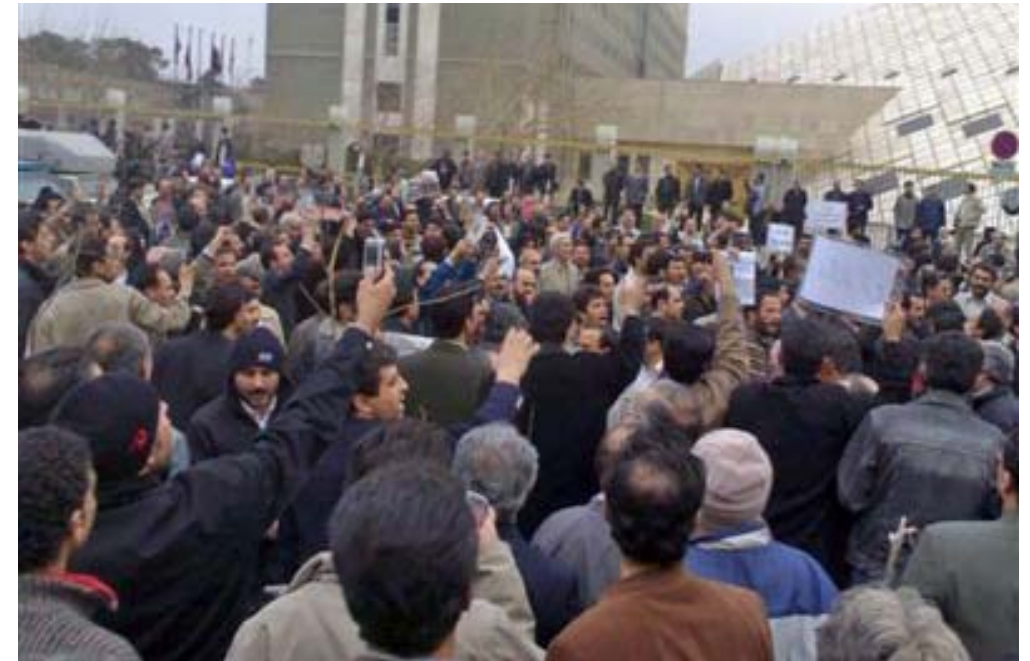
چالاكانى ئهم بواره به روونى ده رى ده خا كه ئهم شىوازى له نه ته وه ييه كانى كورد له رۆژه لاتى كوردستان ته وه رى

په ره گرتن دايه. كورته ئاوپنك له نيوه رۆكى ئامانچ و داخووزييه كانى خهبات ئه گه رچى هه لگرى كۆمه لىك داخووزى پيشه يى و سينفويه به لام ئامانچ و داخووزه