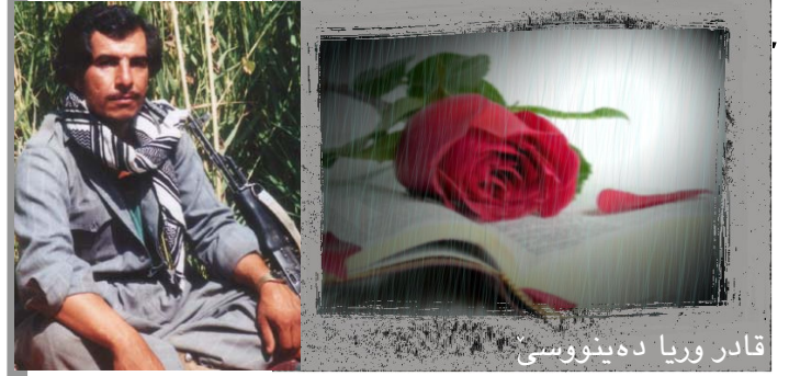
قادر وریا دەبیوسی