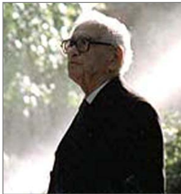
پۆل دوا کاتهکانی سه عاتی خویندنی تیپه پر ده کرد که خویندکاریکی نورویژی