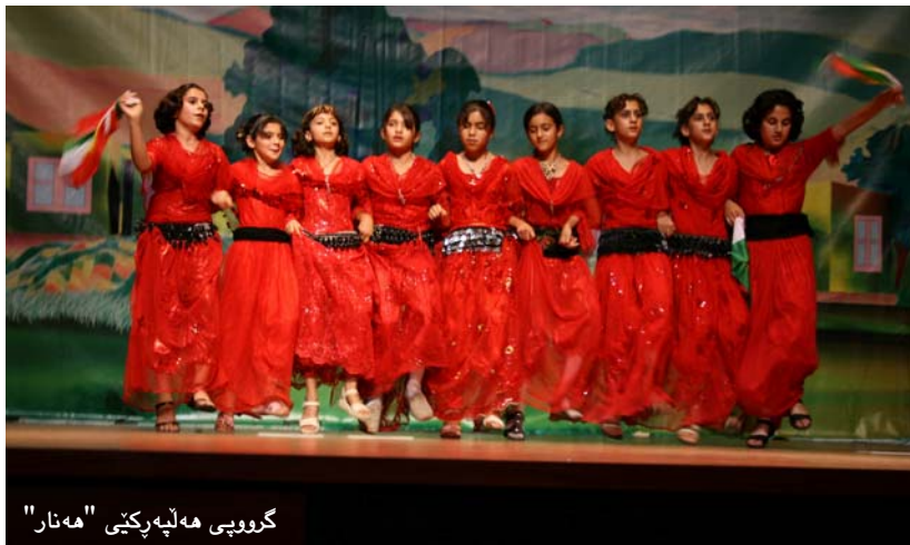
گروپی هه لپه رکئی "هه نار"

سه ر له به یانی رۆژی ۶/۱ / ۲۰۰۷ له ئەتیکه خانه ی هه ولیر، ریوره سمی کرانه وه ی یه که مین فستیفالی جیهانی مندالان له کوردستان، به به شداریی ۱۵۰ مندالی به هره مهندی کورد و غهیری کورد به ریوه چوو. یه که مین برگی فستیفاله که به مارشیک له لایه ن گروپی زه یوتونه وه دهستی پئ کرد. برگی دووه م، نمایشی وه رزشی ته کواندۆ بوو که له لایه ن گروپی زه یوتونه وه به ریوه چوو. برگی سیهه م نمایشی هه لپه رکیه کی هیمایی و فولکلوری کۆریا بوو که له لایه ن گروپی زه یوتونه وه به ریوه چوو. شایانی باسه ئەم فستیفاله یه که مین فستیفالی جیهانی مندالانه که له هه ریمی کوردستان به ریوه ده چی.