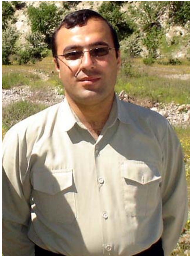
— به‌ راشکاوی‌یه‌وه ده‌لێ‌م که شوێ‌ن پە‌نجە‌ی منداڵان بە‌سەر زۆر له‌ بابە‌ت و لاپه‌ره‌کانی هەر کام له‌ ژماره‌کانی دنیای منداڵان‌وه دیاره. به‌لام تا ئێ‌ستا وهك بۆ‌خۆ‌ت ده‌لێ‌ی ئە‌وه‌ گه‌وره‌کانن که سه‌رپه‌رشتی ده‌رچوونی گۆ‌قاره‌که‌ ده‌که‌ن. هه‌لبە‌ت بە‌رێ‌وه‌بە‌ری "دنیای منداڵان" له‌ ماوه‌ی ٥ سالی رابردوودا توانیویە‌تی کۆمه‌ڵێ‌ک قە‌له‌م و توانای باشی منداڵان له‌ بواره‌کانی نووسین و وه‌رگێ‌ران دا بدۆ‌ژێ‌ت‌وه‌ و په‌روه‌رده‌یان بکا. ده‌بینین که وا نێ‌زیک به‌ ٢ ساله "دنیای منداڵان" له‌ ژێ‌ر چاره‌دێ‌ری دە‌ستە‌ی نووسە‌رانی خۆ‌ی دا ئاماده‌ی چاپ و بڵاوبوونە‌وه‌ دە‌بێ‌ که جگه‌ له‌ سه‌رنووسه‌رو هاو‌پێ‌یه‌کی دیکه، هەر هه‌موو ئە‌ندامانی دە‌ستە‌ی نووسه‌رانه‌که‌ی منداڵان خۆ‌یان. جیا له‌ ستافی نووسه‌رانی دنیای منداڵان، منداڵانی دیکه‌ش له‌ نێ‌و کە‌مپە‌کانی حیزب راسته‌وخۆ له‌ شوێ‌نه‌ جیا‌جیا‌کانی کوردستانیش له‌ پێ‌گە‌ی نامە‌ و تە‌نانە‌ت منداڵانی کوردی نیشته‌جێ‌ی دەر‌وه‌ی و لاتیش له‌ پێ‌گە‌ی ئێ‌مه‌ی‌له‌وه‌ بابە‌ت بۆ‌ دنیای منداڵان ده‌نێ‌رن و هاوکاریی بلاقۆ‌کی خۆ‌شه‌یستی خۆ‌یان ده‌که‌ن.