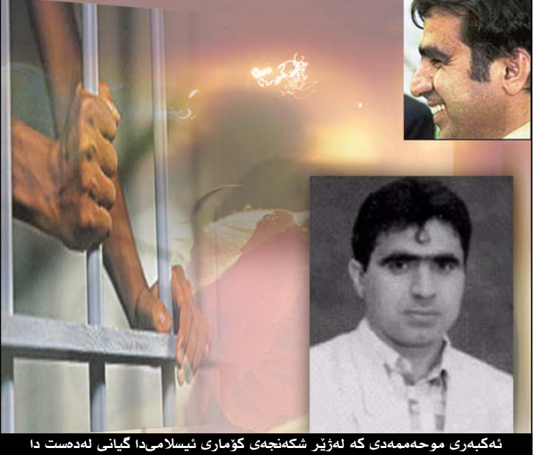
نه که بری محه مه دی که له ژێر شکه نه چی کۆماری ئیسلامی دا گیانی له ده ست دا

به رپێز کاک کۆسه رت و باقی هاو رێیانی یه که یه تی نیشتمانی بۆ چوونه کانی خۆیان سه باه رت به پێشکه و ته کانی پرۆسه ی