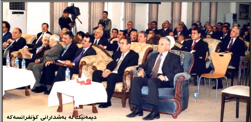
دیبه نیک له به شدارانی کونفرانسه که

زوری بیریاران و بیرمه ندانی مه زنی جیهان لهو باوه ده دان که "نازادی" گه وه ره "بون" ی مرؤقه له هه مان کاتیش دا، دیارترین توخی جیا که ره وهی مرؤقه له هه موو بو نه وه ره کانی سهر روی زه ی. "نازادی" یه ش نه نیا چه مکیکی تینتیزاعی رووت نیه، به لکو "نازادی" له پیوه ندی له گه ل مافی "هه لیزاردن" دا مانا پهیدا ده کا. به پیی نه م بنه مایه، مافی دیاریکردنی چاره نووس، پیوه ندی یه کی راسته خوئی له گه ل "نازادی" و "هه لیزاردن" دا هیه. نه گه مرؤقیک یان نه ته وه یه ک له مافی بیراردانی چاره نووس بیبهش بکرت، بی نه ملاو نه ولا نه وه ده گه بیته که مرؤق یان نه ته وهی ناماژه پیکار له "نازادی" و "مافی هه لیزاردن" بیبهش کراوه.