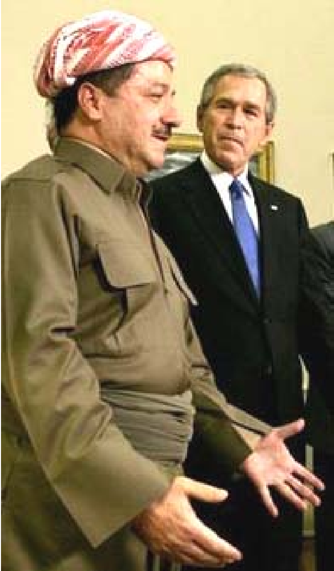
بەرێز مەسعوود بارزانی لەگەڵ سەرکۆماری ئامریکا له کۆشکی سپی - ئامریکا

به شوین سەردانه سەرکهوتوانهکە بەرێز جەلال تالەبانی بۆ ئامریکا قەسەکردن بە زمانی کوردی له کۆری گشتییی رێکخراوی نەتەویە کەگرتووکاندا، هەتووی رابردوو سەرۆکی هەریمی کوردستانی عێراق، بەرێز کاک مەسعوود بارزانی بە سەرۆکایەتیی شاندیکی بەرز له گەورە لێپرسراوانی حکومەتی هەریمی کوردستان بە سەردانیکی رەسمی گەیشته ئامریکا له لایەن سەرکۆماری ولاتە یەکگرتووکانی ئامریکا، جۆرج دهبلیو بووشە به گەرمی پێشوازی لێ کرا. سەردانی بەرێز مەسعوود بارزانی، وەك سەرۆکی هەریمی کوردستان و پێشوازی لێکردنی له لایەن جۆرج بووش، وەك سەرکۆماری بەهێزترین دەسه‌لاتی دنیایە، بۆ نەتەویە کەمان بە گشتی و بۆ باشووری کوردستان بە تاییبەتی، دەسکەوتیکی میژوویی و نەتەویەیی. سەرکۆماری ولاتە یەکگرتووکانی ئامریکا بە رەسمی پێشوازی له مەسعوود بارزانی وەك سەرۆکی هەریمی کوردستان کردو ناوبراوی وەك پیاوێکی نازاوی دیموکراسیخواز ناوبرد كە خۆی و نەتەویە کەمان نازاوی و سەر بەستیی ولاتە کەمان دا خەباتیکی رەواو بێچانیان کردووە نەهوش به لای ولاتە یەکگرتووکانەوه جیتی باهەخ و گرینگی پێدانە. سەرۆکی هەریمی کوردستان مەسعوود بارزانی بە زمان و جلوبەرگی کوردی یەوه، له لایەن خۆی و نەتەوی