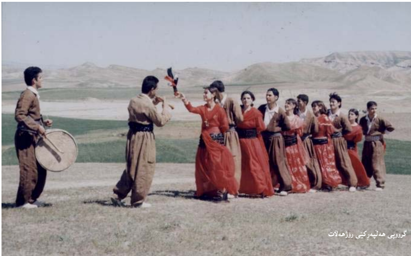
گوردی ھەلپەركى رۆزھەلات

گەريان. گەريان لە زمانى كوردى دا بە ماناى گەشت و گوزار، گەران و رۆبىشتە و جوولەكانى ئەم شێوھەش ماناى گەشت و گەران لە ھىز و زەين دا دووبارە دەكاتەوه. ماناى ھاوشىوھى گەريان يا رۆبىشت بۆ مەيدانى شەر. يانى كەوتىنە رى و رۆبىشتىن. لەم شێوھە ھەلپەركى بەدا زيان بە ھەموو سەختى و تازارەكانىيەوه رەنگى داوتەوه و ئەزمونەكان بۆ رووبەر و بوونەوه لەگەڵ رەنج و سەختى يەكان نىشان دەدا.