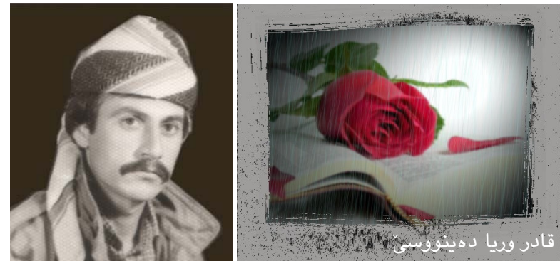
قادر وریا دەینووسی