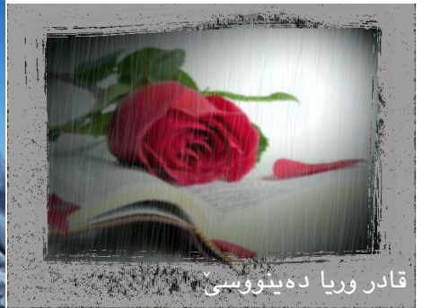
قادر وریا دەینووسی