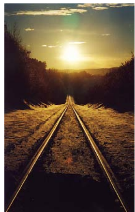
قادر عەلی خانزەر. وییلاگی کوردی