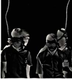
سنه ئیعدام کران. فیدراسیۆنی نیونه ته وه یی کۆمه له کانی

مافی مرۆف و کۆمه له ی داکۆکی له مافی مرۆف له ئیران دا به توندی ئیعدامی ئه و دوو لاره کورده یان مه حکوم کرد. پێویسته بگوتی کۆماری ئیسلامی هیز راگه یه ندرایکی له باره ی چۆنیه تی موحا که مه ی ئه و دوو که سه بلاو نه کردۆ ته وه.