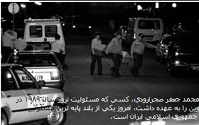
محمد جعفر صحرارودی، کسی که مسئولیت ترور سال ۱۹۸۹ در این راه عهده داشت، امروز یکی از بلند پایه ترین مسئولین جمهوری اسلامی ایران است.