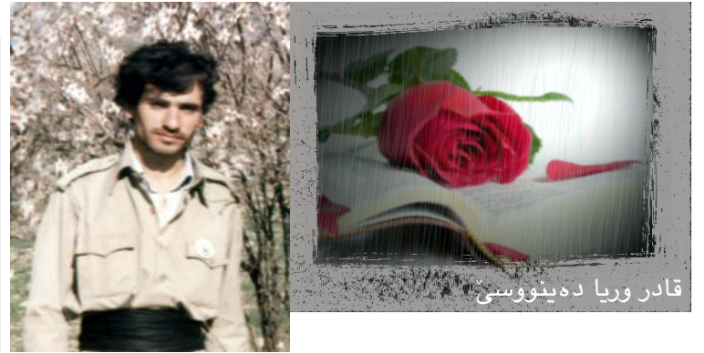
قادر وریا دەینووسی

تای بگەم لە باوہشی مانگیکی نوێ، بدیہ دەستانم وینەت کاتیەک تۆفانی جەستەم! تییکەلم کە لە گەل ئەندیشە سوورە کانت ھاوارت دەکەم منیش شەپۆل شەپۆل. تاجمەوی بسانم خۆم بێ کۆتایی ببارە تۆ لە ژیانم، لە بەرزنی شانت دا کاتیەک زمان دەگرن ھەموو رەمزی خۆشیەکان. بۆ ماچیکە رووبەرگی لاپەرە لیت دەگری خاکم ئیستاش کە ئیستایە. بە ھەزار جار خۆشەویستی، بۆ سێ گەل، لە دوو شەپۆلی سەوزدا، چوار جار ئاواز خۆینی خاک دەبم بە چرۆ لە گۆلدانی گەلاویژت. دەگرم بەل لە بەرزنی منارە عومرت، با بۆ جوانیت سەردە کەوم ھەرمی ھەرمی لە نیو قەدی گەرە بوون. ئیستاش کە ئیستایە تاجمەم لە گومان دام لە ھەر ستوونیک شیعرا پشت دەبەستم بە ھۆنراوہت. بۆ رۆژی لەدایک بوونت تەنیا من نیم دەخۆم ھەسەرەت، خەوای چاوەڕوانی تۆیە تیپەرە جارێک خۆزگە لە چۆلی کۆلانی عەشقمان یا ھەناسەت بەدی لە پەنجەرە خەیاڵمان رۆژکە یەوہ شەوگاری تاریکی تەمەن!! تا پێ بگەم لە باوہشی مانگیکی نوێ،