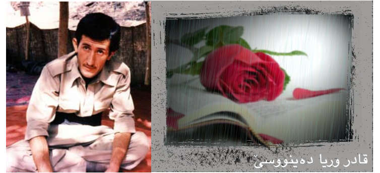
قادر وریا ده‌ینووسی