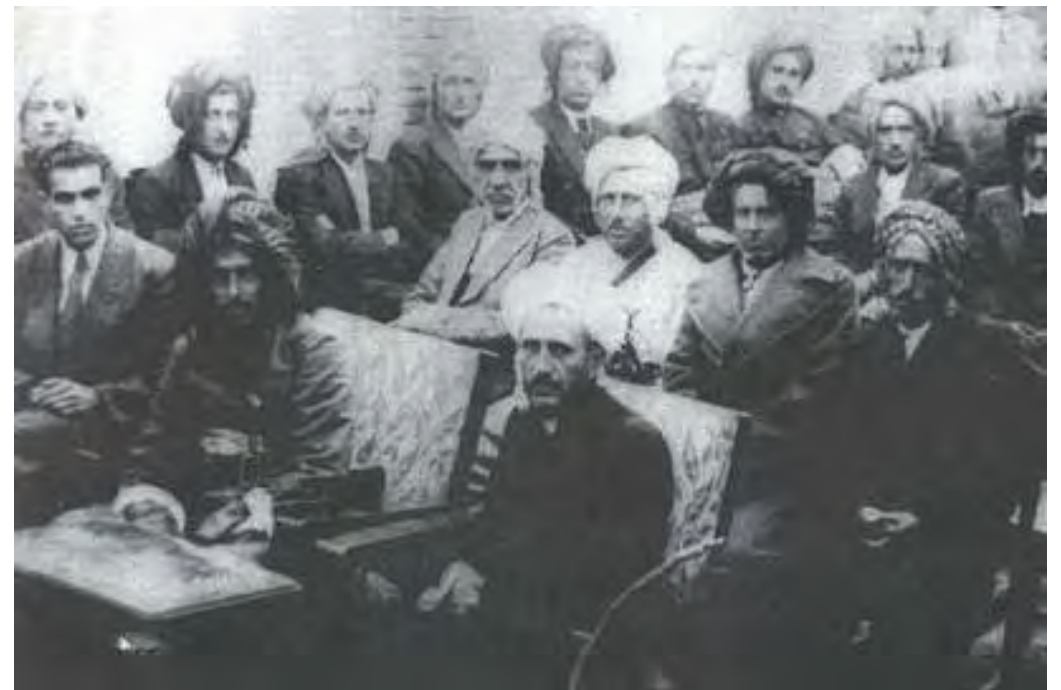
قازي محمهدو و ئەندامانی کابینه ی کۆمار

سه دري قازي باسی ليوه کرا، یه که م ده رسه که له سه رۆکیکی نه ته وه یی بۆ گه له که ی به جی ماوه . ئەگه رچی دوژمنان پیمان وایه که به شه هیدکردنی گه وره پیاوانی میژووی پر له شانازی گه له که مان ده توانن ده نگه گه ل کپ بکه ن. به لام خوینی شه هید ناو نه ئاگری شویش بوکۆنیته وه. قاره مانانی گه ل و نیشتمان به فیداکردنی گیان له کاتی پیویست له ریگی میلله تا دا گه وره ترین زه بر له په یکه ری داگرکرانی کوردستان ده وشتین و به و له خۆبردوویی به شیان بۆ هه میشه ده چنه ناو دل و دروونی گه له وه. هه ر بۆیه ئیستا که زیاتر له نیو سه ده به سه ر شه هید کردنی سه رۆک کۆماری کوردستان و هاوړپيانی دا ته ده په ری ئەوان رۆژ ده گه ل رۆژ هه ر خۆشه ویسترن تا ئەو جیگایه ی که