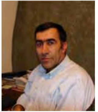
برایم جههاتگیری - کانادا

له میژوو گهلانی جیهان دا هیندی روداو هه ن که له لایه حیزبو لایه نه سیاسییه کان، که ساپیایه یه سیاسییه کان، نووسران و رۆژنامهوانان سهرنجی تابییهتی دهدریتی. له گوشه یهکی بچوکی ئەم جیهانهش دا روداوئیکی گهره میژوویی سهرنجی زۆر کەس و لایه نی بۆ لای خوئی پاکیشاوه، له نووسه رو رۆژنامهوانی نیوخوویی و ریبهری حیزبه سیاسییه کان را بگره تا دهگاته دیپلوماتو نووسه رانی بیانی، دهیان بابته و کتیبیان له سهر نووسیوه. ته نانهت دوژمنانیش نهیان توانیوه له گهره یه عه زه مه تی ئەم روداو به کم بکه نه وه. ئەو روداو به گهره یه " کۆماری کوردستان" ه که له سالی ١٣٢٤ دا له ژیر ریبه یه حیزبی دیموکراتی کوردستان دا، به سه رۆک کۆماری پيشهواي نهر قازي محمهدو له چوار چرای مههاباد راگه یه ندر، کۆماریک که له ماوه ی نزیک به ١١ مانگ ته مه نی پر له سه روه ری خوئی دا خالیکی دیارو وه چهره رخانیکی گرینگی میژوویی بوو بۆ نۆزی رهوا ی گه لی کوردستان.