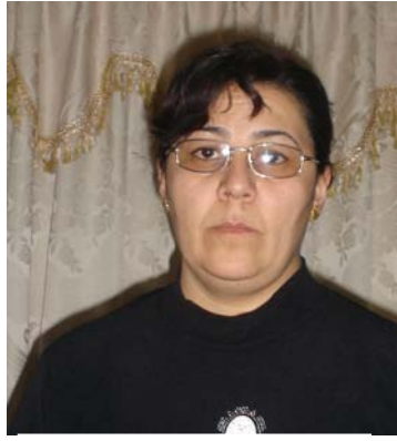
سوهه‌یلا، وێژه‌ری رادیوی ده‌نگی کوردستان