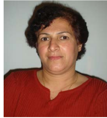
گهلاویژ، بهرپرسی کۆری بهروره‌دهی حیزب