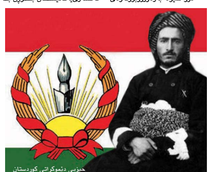
ح‌ی‌ز‌ب‌ی د‌ی‌م‌و‌ک‌ر‌ات‌ی ک‌و‌ر‌د‌س‌ت‌ان

ش‌ار‌ه‌ک‌انی د‌یک‌ه‌ی ن‌از‌ه‌ر‌ب‌ای‌جان ل‌ه‌ م‌ه‌ه‌ا‌ب‌اد د‌و‌وی‌ات ب‌ن‌ه‌و‌ه‌. ق‌از‌ی‌ه‌ی‌ک‌ان - ق‌از‌ی م‌ح‌م‌م‌ه‌د، ئ‌ه‌ب‌ول‌ق‌اس‌م‌ی س‌ه‌د‌ری ق‌از‌ی‌ی ب‌رای و م‌ح‌م‌م‌ه‌د ح‌وس‌ی‌نی س‌ه‌ی‌ف‌ی ق‌از‌ی‌ی ئ‌ام‌ۆ‌ز‌ای - ی‌ان ب‌ه‌ د‌اد‌گ‌ای ز‌ه‌م‌انی ش‌ه‌ر ئ‌ه‌س‌پ‌ار‌د: د‌اد‌گ‌ا س‌ز‌ای ئ‌ی‌ع‌د‌ام‌ی ب‌ه‌س‌ه‌ر ه‌ه‌ر س‌ی‌ک‌ی‌ان دا س‌ه‌پ‌اند و ب‌ر‌ی‌اری د‌اد‌گ‌ا ب‌ه‌ ش‌ه‌و، ر‌اس‌ت س‌ال‌ئ‌ک‌ پ‌ۆ‌ژ‌ئ‌ک‌ ک‌ه‌م پ‌اش ر‌اگ‌ه‌ی‌ان‌د‌نی خ‌و‌د‌م‌و‌خ‌ت‌اری، ه‌ه‌ر ل‌ه‌ م‌ه‌ی‌دان‌ی "چ‌وار‌چ‌را" ی‌ه‌ ب‌ه‌ر‌ی‌و‌ه‌ چ‌و‌و‌ ک‌ه‌ ق‌از‌ی م‌ح‌م‌م‌ه‌د ل‌ه‌ س‌ال‌ی پ‌ی‌ش‌ت‌ری دا، ب‌و‌و‌نی ح‌ک‌و‌م‌ه‌ت‌ی خ‌و‌د‌م‌و‌خ‌ت‌اری ک‌و‌ر‌د‌س‌ت‌انی ت‌ی‌دا ر‌اگ‌ه‌ی‌ان‌د، ج‌ی‌ب‌ه‌ج‌ئ‌ ک‌را".