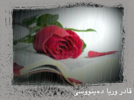
قادر وریا دەییووسی