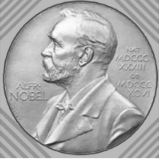
وک هه‌موو سالی، ناکادیمی سوئید له‌ سه‌ره‌تای پاییزدا، ناوی نه‌و که‌سه‌نێ راگه‌یاند که‌ خه‌لاتی نۆبێلیان پێ به‌خشره‌وه‌. خه‌لاتی نۆبێلی نه‌ده‌یه‌ی ئەمساڵ به‌خشره‌وه‌ به‌خاتوو ئەلفه‌ریده‌ یه‌لینک که‌ نووسه‌ر و ده‌ره‌گرێکی فیلمیکیشی نۆتریشی-یه‌ و ته‌مه‌نی

٥٧ ساله‌، ناوبراو یه‌که‌م نووسه‌ری نۆتریشی و ده‌یه‌مین ژنه‌ که‌ نۆبێلی ئەده‌بیات و هه‌رده‌گرێ. ئەلفه‌ریده‌ یه‌لینک به‌ دواى نووسینی رۆمانی "مامۆستای پیاو" که‌ سالی ٢٠٠١ فیلمیکیشی لێ دروست کرا، ناوبانگی ده‌رکرد. ئەو خانمه‌ له‌ ماوه‌ی سالانی ١٩٩١ - ١٩٧٤ دا و لاتنه‌که‌ی خۆی - نۆتریش - به‌ شه‌ریکی تاوانی نازی-یه‌کان و جینایه‌تکار ناوبراو به‌مجۆره‌ گۆنگه‌لی بۆخۆی ساز کرد. روانگه‌ سیاسی-یه‌کان و روونکردنه‌وه‌ی راشکاوانه‌ی یه‌لینک له‌باره‌ی پێوه‌ندی-یه‌ مرۆقایه‌تی-یه‌کان له‌سه‌یه‌ری کۆشه‌وه‌ نێگه‌رانی-یه‌ کۆمه‌لایه‌تی-یه‌کان دا، وای کرد له‌ زیندو نیشتمانی خۆی دا زۆر که‌س دوژمنایه‌تی-یه‌ بکه‌ن، به‌لام که‌سانی نه‌وتۆش زۆر که‌س به‌ نووسه‌ریکی ٥٧ ساله‌، ناوبراو یه‌که‌م نووسه‌ری نۆتریشی و ده‌یه‌مین ژنه‌ که‌ نۆبێلی ئەده‌بیات و هه‌رده‌گرێ. ئەلفه‌ریده‌ یه‌لینک به‌ دواى نووسینی رۆمانی "مامۆستای پیاو" که‌ سالی ٢٠٠١ فیلمیکیشی لێ دروست کرا، ناوبانگی ده‌رکرد. ئەو خانمه‌ له‌ ماوه‌ی سالانی ١٩٩١ - ١٩٧٤ دا و لاتنه‌که‌ی خۆی - نۆتریش - به‌ شه‌ریکی تاوانی نازی-یه‌کان و جینایه‌تکار ناوبراو به‌مجۆره‌ گۆنگه‌لی بۆخۆی ساز کرد. روانگه‌ سیاسی-یه‌کان و روونکردنه‌وه‌ی راشکاوانه‌ی یه‌لینک له‌سه‌یه‌ری کۆشه‌وه‌ نێگه‌رانی-یه‌ کۆمه‌لایه‌تی-یه‌کان دا، وای کرد له‌ زیندو نیشتمانی خۆی دا زۆر که‌س دوژمنایه‌تی-یه‌ بکه‌ن، به‌لام که‌سانی نه‌وتۆش زۆر که‌س به‌ نووسه‌ریکی