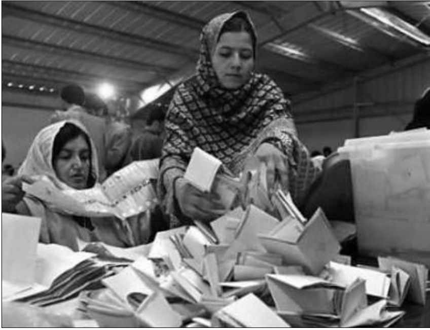
ژماردنی دەنگەکان لە ھەلېئاردنی سەر کۆماریي ئەفغانستاندا

رۆژی شەممە ۱۸ رەزەبەر (۹ ئۆکتوبری) ئەمسال، یەكەمەن سەرۆك كۆماریي ئەفغانستان بە بەشداریی ۱۸ كاندیدا لە ۱۹ نۆستانى ئەو ولاتەدا بەرپۆچوو. ئەو ھەلېئاردنەدا زیاتر لە ۱۰۰ ھەزار كەس ەك ھیزی ئەمنییەتی بۆ وێنە ۲۷ ھەزار كەس ھیزی بیانی ئەركی پاراستنی ئەمنییەتیان بەرپۆچ دەبرد. ھەربۆیەش دەركۆ بلیتین تاراڤیەك ھەلېئاردن لە كەشووھەوايەكى ئارامدا بەرپۆچوو كە لە ماوەی ھەلېئاردندا ھەوالدەركان تەنیا ناماژەیان بە تەقینەوێ دوو مووشەك لە شاردكانى "گەردیز" و "ئەسەدئاباد"دا كرد. شایانى باسە كە خراپیی جەوھەرى مۆركردن لەگەڵ ناپەزایەتی كاندیداكانى ھەلېئاردن رووبەروو بوو كە ۱۵ كەس لەو كاندیدایانە خوازىارى راگرتنى دەنگدان بوون و رایانگەیانە كە ئەم كەموكۆرییە دەبێتە ھۆى ئەو رەوايی ھەلېئاردن بچیتە ژێر پرسیارووە. بەلام، نوێنەرانى یەكەستىي ئوروپا، رێكخراوى نەتەو یەكگرتووھەكان و سەرجم ئەو ھەبەتەنەى چاودەریی ھەلېئاردن بوون، خوازىارى درێژەدان بە پڕۆسەى دەنگدان بوون و تەنناەت بە مەسەلى لێكۆلینەو ھەو مەسەلە یە ھەبەتەتیکان پێك ھینتا كە ئەویش دواى چەند رۆژ لەگەڵ دەستیشانكردنى ھیندۆ وردەھەلە، رەوايی ھەلېئاردنیان دووپات كردووە.