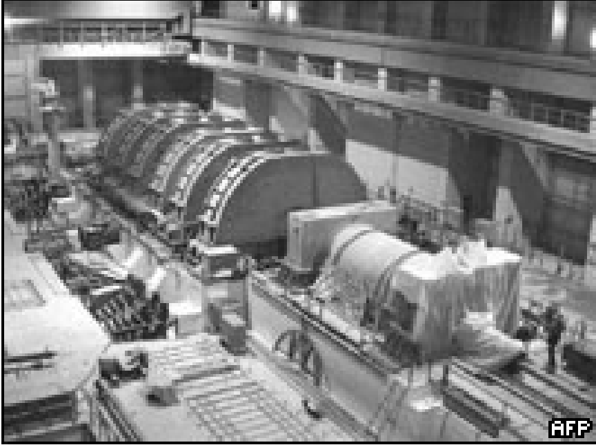
ئىران قىددىيەى ساز كىردنى چەكى ئەتۈمى، رەت دەكانتەوہ

كردوہ كە لە NPT دەردەكەون و ترىسيان لەوہش نىبە كە پەروەندەكە بەرئىتتە ئەنجۈمەنى ناسايش. بەلام، ئەمە ھەر تەنيا قەسى رووتەو ئەوان ناتوانن لە بەرامبەر فشارى نىئوئەتەوہيىدا خۇيان راگىرن، بەتايىبەت NPT و سىن و لاۋتى ئۆووپايى و ئامىرىكا، ھەرودھا نۆئىنەرانى گرووپى ھەشتىش بە يەك دەنگ داواى راگرتنى چالاكىي ناوكىي لەلايەن ئىزانەوہ دەكەن. ئەمەش پىشانەردى ئەوہيە كە ھەتا دى رىژىمى كۆمارى ئىسلامى لە ناستى نىئوئەتەوہيىدا پىتر تەرىك دەكەوتتەوہو كۆدەنگىيەكى جىھانى لە دژى سەر ھەل دەدا كە ئىدى دەربازبوونى بۇ نىيە. يان دەبىن چالاكىي ناوكىي خۇي ئەگەر نەكرا، ھەرودەك خاويىتر سۇلانا بەراشكاوى وتوويەتى بە پىنى بىرانامەى ئاۋانسى نىئوئەتەوہيى وزى ناوكى، فايلى ناوكىي رىژىم، دەدرىتتە دەست ئەنجۈمەنى ناسايشى سەر بە نەتەوہ بۇ سەپاندى