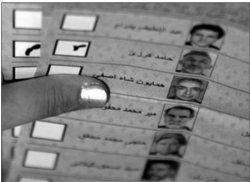
لیستی كاندیداكانى سەر کۆماریي ئەفغانستان

۳- ھەلېئاردن یەكێك لە بنەماكانى دیموكراسى یە. بەشداریی گشت لایەنەى ئەفغانى یەكان لەو ھەلېئاردنەدا نیشانەى ئەو یە كە ئەوان سوورن لەسەر ئەو یە بە پێكھاتەییەكى نوێو لەسەر بنەمای دیموكراسى و پلۇرالیزم و نەزم و یاسا لێك بگەن. ئەو لە حالىك دایە كە ئەفغانستان چوار سالا لە قەیرانى تراژىكى ۳۰ سالی نیوخۆى و حاكیمیەتى ۵ سالی سەدە ناوەرپاستىیانەى تالیبان و ئەلقاعیدە رزگاربان بوو. ئەفغانەكان بەو ھەنگارە نەتەو یە یە ھەنگاویكى گەورەیان بەرەو دیموكراسى ھەلگرت. گۆفارى "ئێكۆنۆمىست" لەو پێنەندى یەدا دەلى: ئەفغانى یەكان شتیكى ئەوتۆ لە دیموكراسى نازانن،