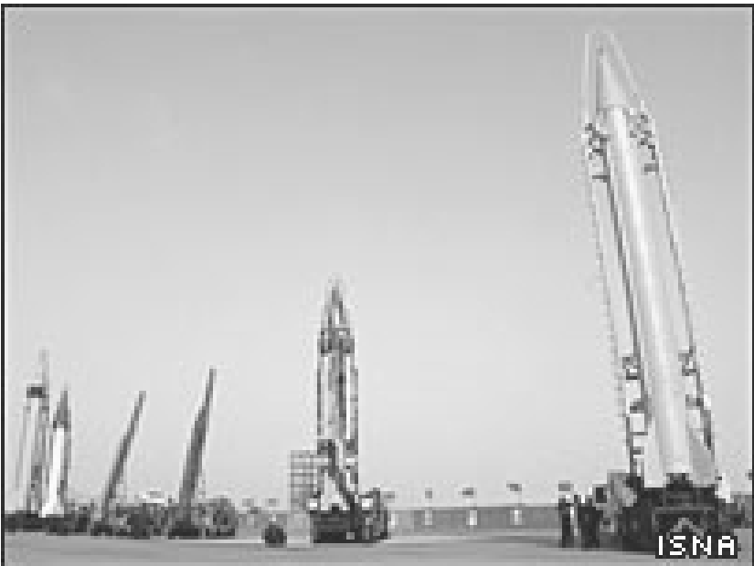
ئىران دەلئ: مەوداي رۇيشتنى مووشەكى شەھابى ۳ى زياتر كىردوہ

ئامىرىكارە دارپىژرايوو، بەكۆى دەنگى ۳۵ ئەندامى ئەنجۈمەنى حاكامانى ئاۋانسەوہ پەسند كراو، بىمچۆرە رادەى شىپىلگىرى و نىگەرانىي ولاۋاننى ئورووپايى سەبارەت بە بەرانامەى ناوكىي ئىران دەرگەوت و ناوتىكى ساردىان بە دەستى كاربەدەستانى رىژىمدا كىردو بەرەبەرە رىگايان بۇ ئەوہ خۇش كىرد كە ئەم كىشەيە بەرنە ئەنجۈمەنى ناسايشى سەر بە رىكخراوى نەتەوہ يەكگرتوہكان. ھەرچەند كاربەدەستانى كۆمارى ئىسلامى ھەلوتىستى توندىان لەم بارەيەوہ گرتوہ رايانگەياندوہ كە ئەم مل بۇ بىرانامەى ئاۋانس راناكىشش، بەلكوو ھەرەشەيان