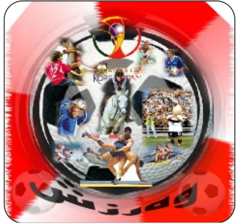
دریژه دیوالا پهره