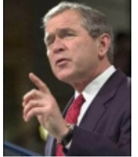
جۆرج بوش سەرکۆمارى ئەمريكا

بەم بۆنەيهوه له زمانى جۆرج بوشهوه بلاوى كردهوه، هاتووه: هەلبژاردنى پارلمانى پر له كيشه و هەللكى ئەم دايەيانى ئییران، منى زۆر ناھەمید كرد. رەتكراوهوى سەلاحييەتى زياتر له ۲۴۰۰ كاندیدای نوێنەرايەتى لهلايەن شوورای ناھەلبژێردراوى نینگابانەوه، زۆر له ئییرانى يەكانى له ئيمكانى هەلبژاردنى نازادانەى نوێنەرى خۆيان بپەيش كرده. مینش هەولەنگ لەگەل خەلكى زۆر له ئییران و سەرانسەرى جيهان، هەولەكانى راپۆرسى ئییران بۆ خنكاندن سازادى بىروپرا دەرپيرين، يەك لەوان داخستنى دوو روژنامەى پيشەرى راپۆرسەكانى بەرپەرەردنى، مەحكوم دەكەم. ئەم جوړە هەنگاوانە حكومەتى قانۆن لاواز دەرکەنو هەولێكى ناشكران بۆ رەتكردنەوى داخووازی خەلكى ئییران له بەرى هەلبژاردنى نازادانەى راپەرانی حكومەتى. وڵاتە يەكگرتووەكانى ئەمريكا له ويستى خەلكى ئییران لەبەرى ژيان لە سببەرى نازادى دا و دەستگرايشتيان بە مافەكانيان، هەروها لە بريارى ئەوان بۆ بە دەستەو گرتنى چارەنووسى خۆيان، پشتبوانى دەكا. سەرچاوه: مالمپرى "ايران امريز" ۵ى رەشەمەى ۱۳۸۲