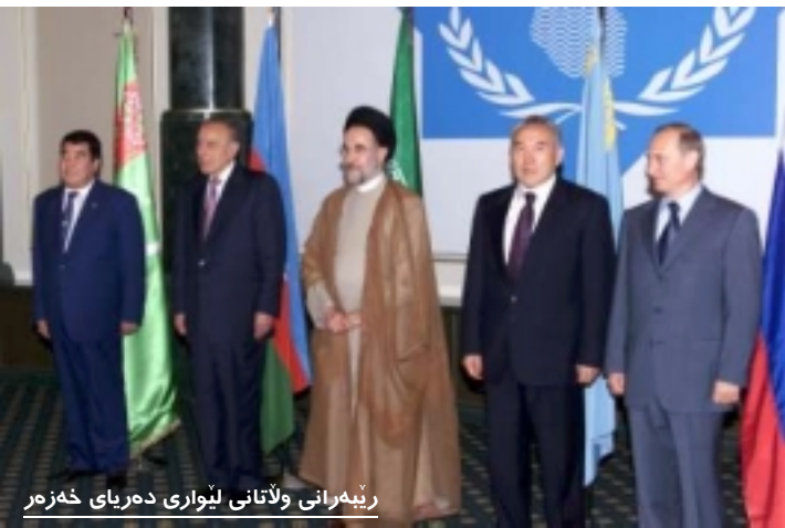
ریه‌هرانی ولاتانی لیواری دهریای خه‌زه‌ر

دوای رووخسانی شوورده‌وی، سه‌ربه‌خۆبوونی ولاتانی قه‌زاقستانو تورکمه‌نستانو کۆماری نازه‌ربایجانو، دۆزینه‌وی نه‌فتو گازی تازه له قولاویی دهریای خه‌زه‌ردا، له‌لایه‌ن کومپانیاکانی دهره‌وه، ریکه‌تنامه‌کانی پی‌شوو که له‌سه‌ر "مشاع" داریژرابوو، به‌هۆی رکه‌به‌ریی ولاتانی میحوه‌ری خه‌زه‌ر له نیعتیار که‌وتن. به‌ره‌هه‌ر له‌سه‌ر ریژیمی حقوقی دهریای خه‌زه‌رو شێوه‌ی که‌ل‌ه‌وه‌رگرتن له سه‌رچاوه سروشتی‌یه‌کانی ئەو دهریایه‌، کێشه‌کان سه‌ه‌ریان هه‌ل‌دا. له‌و