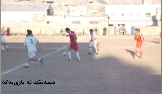
دیمه‌نێک له یاری‌یه‌که

شه‌م کێبه‌رکی‌یه‌ رۆژی ۱۰ی به‌فرانباری ۱۳۸۲ به‌ به‌شداریی تپیه‌کانی: هه‌لبژارده‌ی حیزبی دیموکرات، لاوانی دیموکرات، هه‌لبژارده‌ی رانیه‌، سه‌ی چرای کۆیه‌ ده‌ستی پێ‌کرد و له ناکام‌ دا دوو تپیی هه‌لبژارده‌ی دیموکرات و سه‌ی‌چرای کۆیه‌ گه‌یشته‌ قۆناخی کۆتایی. له یاریی کۆتایی دا سه‌ره‌نجام تپیی سه‌ی‌چرا به‌ لێدانی پناڵتی توانی بیته‌ته‌ براوه‌ی شه‌م کێبه‌رکی‌یه‌.