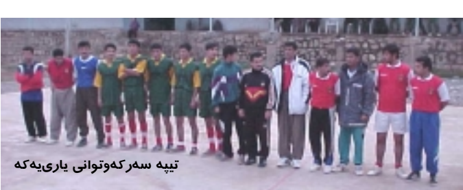
تپیه سه‌رکه‌وتوانی یاری‌یه‌که

رۆژی ۶ی به‌فرانبار ۱۳۸۲ له ژێر چاوه‌دێریی به‌شی وه‌رزشیی کۆمیس‌یۆتی فێرکردن و لێکۆلینه‌وه‌ی حیزب، کێبه‌رکی‌یه‌کی گۆلی بچووک به‌ به‌شداریی ۱۴ تپیه‌و به‌ شپۆه‌ی ته‌ک چه‌زفی به‌ری‌وه چوو. ناوی شه‌و تپیه‌نه‌ی کێبه‌رکی‌یه‌ بوون، بریتی بوون له: ناوه‌ندی یه‌ک، نه‌خۆشخانه، ناوه‌ندی دوو، هه‌رواز، شۆرش، په‌زیرش، به‌ندبخانه، ته‌قه‌مه‌نی، رادیۆ، فێرکردن، به‌شی فیلم ، پاریزگاری(A) پاریزگاری (B)و عه‌بدیی ناوه‌ندی دوو. له کۆتایی شه‌م زه‌نجیره‌ یاری‌یه‌دا تپیه‌کانی شۆرش، نه‌خۆشخانه و فێرکردن و لێکۆلینه‌وه‌ پله‌کانی یه‌که‌م تا سه‌په‌مه‌یان و ده‌ست هیتنا.