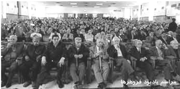
مەراسم یادبود فرۆهه‌رها