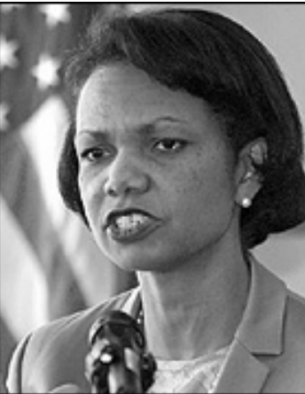
تاوانبارکردنى کۆمارى ئىسلامى ئییران بە ھەولدان بۆ و دەسپەئەننى چەكى نەتۆمى

پەنادانى سەرکردەکانى رېكخراوہى تىرۆرىستى ئەلقاعیدە بەردەوامە. رىچارد باوچىر، و تەببىزى وەزارەتى دەروەى ئەمرىكاش گوتى: زانبارىەکان نىشان دەدەن کە کۆمارى ئىسلامى بەرنامەبەكى نەتۆمى تەواوى بە دەستەوہبە. رۆژى سى شەمە (۲۳ بانەمەر) كانداليزا رايىس، راوێژكارى ئەمىنىيەتى كۆشكى سى گوتى: بەرنامە نەتۆمىەکانى ئىیران جىگای نىگەرانىن. مەك لارىن، و تەببىزى كۆشكى سى گوتى: بەو ھەموو سەرچاوە دەوڵەتەندى گاز و نەوت لە ئىیراندا، ھىچ پاگانەبەك نىب بۆ ئەوہى رېژىمى ئىیران رووى کردۆتە بەرنامە خەرجەلگەرەکانى بەرھەمەئىيانى ئىنسىرئى