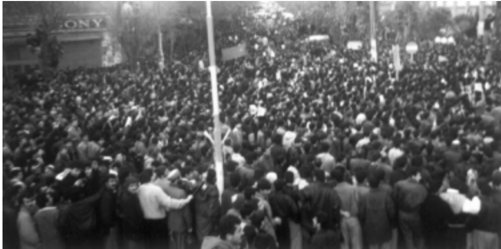
دیمەنیک له خۆپیشاندانی ٣ی رەشەمە ١٣٧٧ی شاری سنه

روژی ٣ی رەشەمە ٧٧، له رەوتی حەره که ته ئیعترازییەکانی خەلکی کوردستان دژی ریزی کوماری ئیسلامی ئیراندا جیگهیه کی تایبەتی هیه. خەلکی قاره مانپەر و هری شاری سنه که له نه وروزی سالی ١٥٨ کوشتاری خەلک و ویرانی شارەکیان وەک یه که م دیاریی ئه و ریزی ه دی، جاریکی دیکه ش به خۆپیشاندانی که م وینه یان بوونه نوینگی ویستو داخوازه کانی هه موو خەلکی کوردستان.