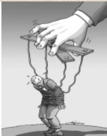
له باره ی گه‌لله‌کانی سەرکۆماره‌وه - مانا نیستانی

له یه‌ك دوو سال له‌مه‌و به‌ره‌وه باسی پێویستی به‌پێوه‌چوونی ریفراندۆمیک ده‌کرێ له لایه‌ن ریفرانمخووانانی ده‌ره‌وه‌ی ده‌سه‌لات له پێش‌دا و پاشان ریفرانمخووانانی نی‌یو ده‌سه‌لاته‌وه‌ هاتۆته‌ گۆڕی. داخوازی بۆ ریفرانم له‌ کاتسه‌وه له لایه‌ن ئه‌و هی‌زانه‌وه‌ هاتۆته‌ گۆڕ که ئه‌وانی‌ش وه‌ك هه‌ر هی‌زێکی دیکه‌ی ده‌ره‌وه‌ی ده‌سه‌لات، سه‌ره‌نجام هاتونه‌ سه‌ر ئه‌و باوه‌ڕه‌ که قه‌بران و گیر و گرفته‌کان له‌نی‌یو خۆی ئه‌و پێ‌وه‌دا چاره‌سه‌ر نابن و پێ‌ویسته‌ په‌نا به‌ریتسه‌ به‌ر ده‌نگی خه‌لكه‌وه‌.