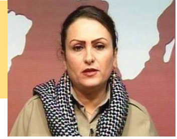
سەرچاوه: ئینتېرنېت وهرگێران: دایکی کیان

جه مسهره و زۆربوونی دهور و رۆله کانیان دا هاوسهنگی پیکر بێنن؟