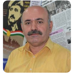
رهزا محهمه دئه مینی