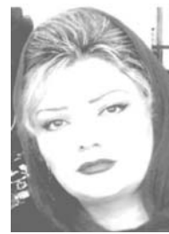
شهيدا ئه ميني