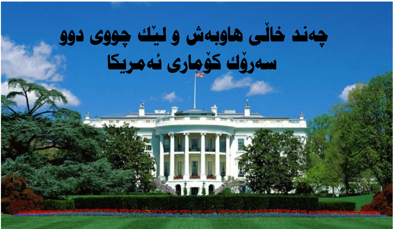
و: شەونەم نوورانى