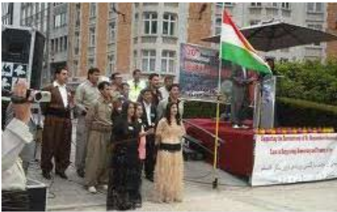
یه کیه تی لاوان له چالاکیه کانیاندا له دهرهوی ولات

خاکه کی دا به ناچاری پهنای بۆ بردبوو. پاش ئهوی که له سالی ۱۳۷۳ دا، ئه یه کگرتوویی و همماهنگیه ئورگانیه که جارن یه کیه تی لاوان هه یوو، به ره لاواز بوون چوو و ئورگانی لاوان چاپ و بلاو نه کرایهوه، یه کیه تی لاوان به کردهوه کارو چالاکیه کانی راوهستا. به لام له گه لاویژی ۱۳۷۸ ی هه تاوی دا له سر داوای کۆمه لیک لاوی خوین گهرم و ههست کردن به جینگه ی به تالی ریکخراویکی تاییهت به لاوان سر له نوێ یه کیه تی لاوان دهستی به کارو تیکۆشان کردهوه و لا پهره یه کی زی رینی دیکه ی له میژووی خۆی کردهوه. به ره به ره ئه ندام و لاینگرانی له دوری خۆی کۆ کردهوه و به ریوه به ریکی گشتی هه لێریدرا و یه که م ژماره ی دوری دووه می گۆقاری لاوان له سالی ۱۳۷۸ ی هه تاوی دا چاپ و بلاو کرایه وه. له گه ل ریکخراوه کانی هاوشیوه ی خۆی به گشتی و ئه و ریکخراوانه ی دا کۆکی له مافه کانی لاوان ده که ن له کوردستان دا، پیوه ندی به تینی دامه زران، یه کیه تی لاوان له دهرهوی ولاتیش به تاییهت له ئورپا کهوته خۆی و کۆمیته کانی دامه زرانده وه لاوانی کوردی له ولاتانه دا له دوری خۆی کۆ کردهوه، دوا ی زیاتر له سالی کروتیکۆشانی به ریوه به ری گشتی له ۴ تا ۶ ی به فرانباری ۱۳۷۹ ی هه تاوی دا یه که م کۆنگره ی یه کیه تی لاوانی دیموکراتی کوردستانی ئیران پینک هات.