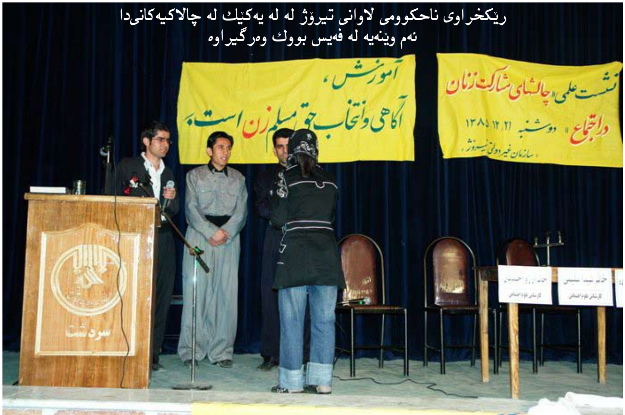
فایلی ژماره: ریکخراوه ناحکوموی بهکان له رژه‌هه‌لای کوردستان دا

۶- هه‌ل‌دان بو پهره‌پیدان به ئاشتی له جیهاندا و له نیو‌بردنیی چه‌که کۆ‌کۆزه‌کان. ئهم ئهنجومنه به هاوکاری خه‌لکی شار سالانه یادی کیمبارانی سهرده‌شت به‌رز ده‌که‌نه‌وه و چه‌ند سال له‌مه‌وبهر هه‌یه‌تیه‌تیکی ژاپۆنی که له هه‌یروشیما را هاتبوون بو سهرده‌شت بهم مه‌به‌سته له‌سهرده‌شت یه‌کیک له شه‌قامه‌کانیان ناو نا هه‌یروشیما و له هه‌یروشیماش شه‌قامیکیان ناو نا سهرده‌شت.