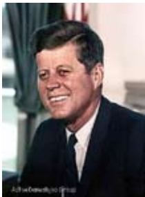
جان ئېف كەنەدى

بە پېي رېنوووسى ئېنگلىزى بەكەي). ۱۱: لىنكۆلن لە شانۆيەك بە ناوى فۆرد كۆزرا و كەنەدىش لە سەيارەيەك دا بە ناوى لىنكۆلن كە لە لايمەن كۆمپانىيى فۆردەو سەز كرابوو، كۆزرا.