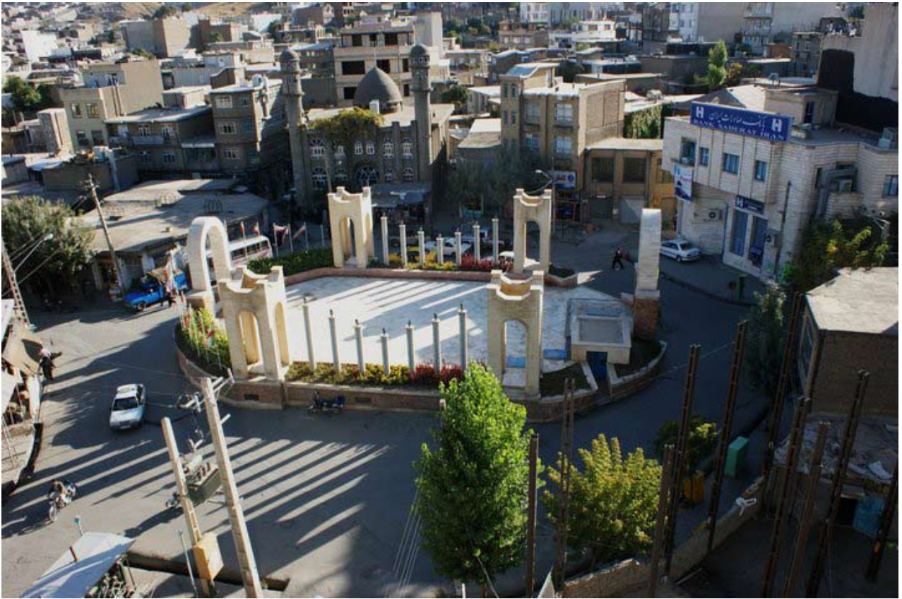
فایلی ژماره: رێکخراوه ناحکومی یه‌کان له رۆژهه‌لاتی کوردستان دا