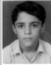
نـازارز عەزیزی پـۆلی شەشەمی سەرەتایی