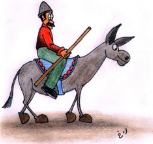
وه‌رگێران له عه‌ره‌یی‌یه‌وه: نه‌مام خوسه‌وه‌ی

وه‌رزێرێکه به ژنه‌که‌ی ده‌گوت نه‌گه‌ر گایه‌که هه‌روا نه‌خۆش بێ تا نه‌مردوووه ده‌یه‌ینه‌سه لای قه‌ساب با سه‌ری به‌ری. گایه‌که له ترسان زوو هه‌ستا و گایه‌که‌ی هه‌موو خوارد، بۆ به‌یانی به‌که‌یف خۆشی وه‌ پێش وه‌رزێرێکه که‌وت و چون بۆ نێو زه‌وی. که‌ره‌که‌ش به‌ ناسه‌روه‌یی پال که‌وت.