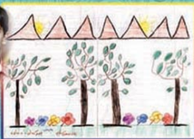
بمیان جووگه لیلی - هشتت ساله