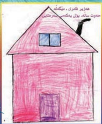
هزیر قادری - نینگه حموت ساله، پولی پهگه می سمرقانی