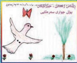
دنگلمان او هغه د جیژنیکان د واده لومړنۍ لوبه لوبولې پولی جوواری سمرقانی