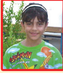
ناشتى بازيار (يەكەمى پۆلى چوارەم)