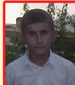
ئاۋات پەھرەۋان (پۆلى شەشەم)