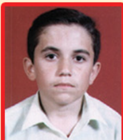
زانبار كوردستانى (پۆلى شەشەم)