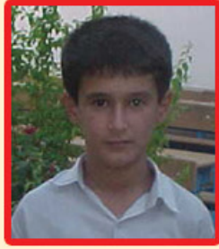
ئەدىب كەسرايى (يەكەمى پۆلى پىنچەم)