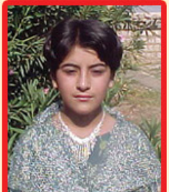
نەشمىل عەبىدى (پۆلى شەشەم)