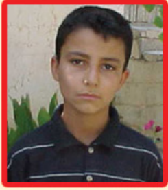
بلباس بلباسى (يەكەمى پۆلى پىنچەم)