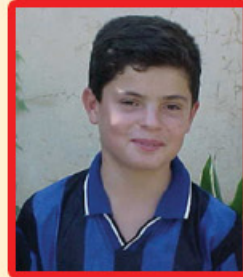
ھەزىر مەنگورى (دووھەمى پۆلى پىنچەم)