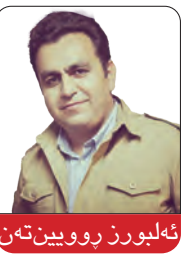
ئەلبورز روویین تەن

(getting to Denmark) یه‌کێک له‌ پرسه‌کانى مێژووى و یگه‌کان ئەوه‌یه‌ که‌ مێژووى ئینگلستان بۆ گه‌یشتن به‌ ديموکراسى ده‌ستوریه‌ به‌ پارادایم وه‌رگرت. به‌لام ده‌کرا هه‌ندیک وڵاتى دیکه‌ی ئوروپایى به‌ نمونه‌ بێنیه‌وه‌ که‌ به‌ رێژه‌وى دیکه‌شدا به‌ هه‌مان شوین گه‌یشتن. هه‌ر وه‌کو ئیمه‌ که‌ له‌ سه‌ره‌تایى ئەو پيساله‌ درێژه‌دا سه‌بارته‌ به‌ په‌ره‌پیدانى سیاسى پرسیمان چۆن دانمارک توانى بێى به‌ دانمارکیکى خاوه‌ن سه‌روه‌ری یاسا، ديموکراتیک و خۆشگوزه‌ران که‌ به‌باشى به‌رپوه‌ ده‌بردى و خاوه‌نى که‌مترین گه‌نده‌لیی سیاسیه‌ له‌ جیهان. بپويسته‌ شروقه‌ی بکهن که‌ چۆن ئەوه‌ به‌دى هاتوه‌.