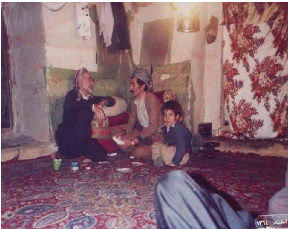
ژماره ۳۲ : پاییزی ۱۳۶۵ : له راستهوه : ۱- رزگار - ۲- خۆم - ۳- باوكم