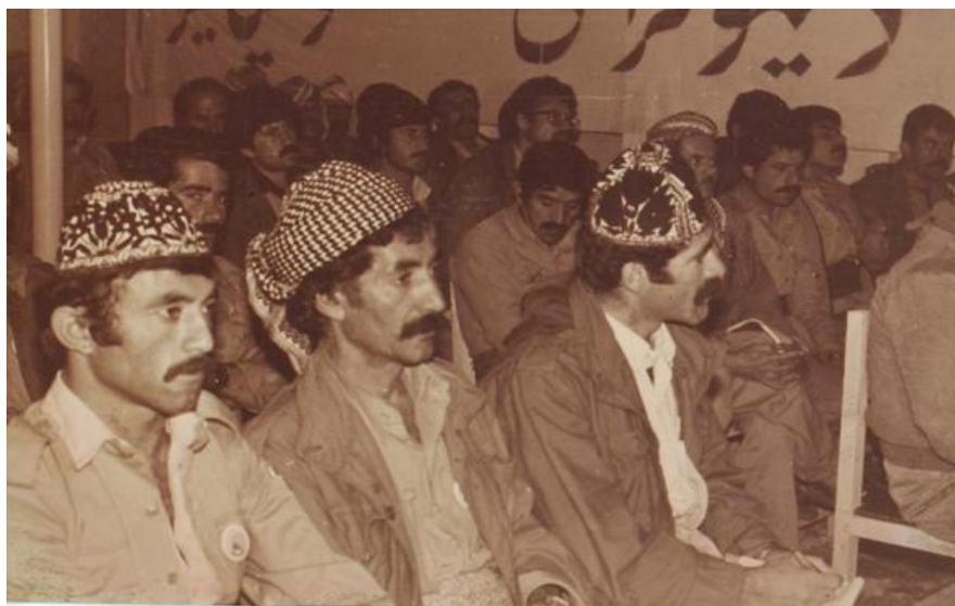
ویندهی ژماره ۲۲ : کونگره‌ی ۷ - ۱۳۶۴ ی هه‌تاوی