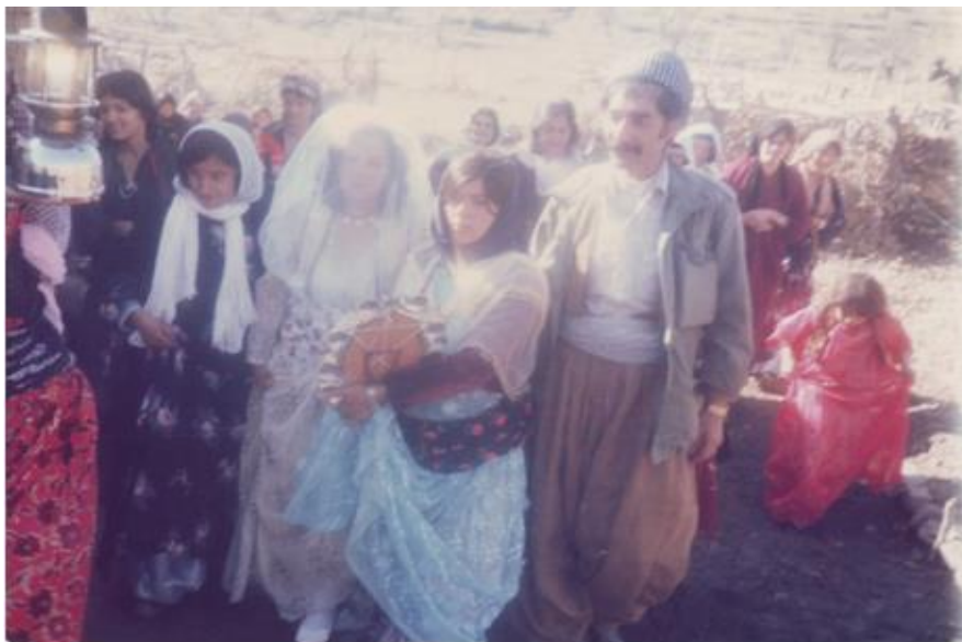
ویندهی ژماره ۲۱