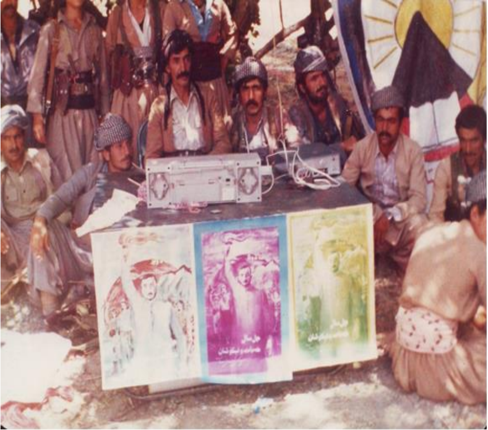
وینہی ژماره ۱۷ : ناوچهی بانه - گوندی مینوهکاژاو - جیژنی ۲۵ ی گهلاویژی ۱۳۶۴ ی همتای که بهر نیوهبیری بهر نامه بووم.