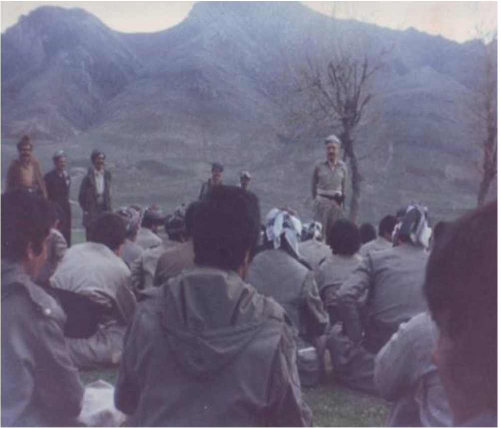
ژماره ۲۶ : گۆبوونەوێ شەهید دوکتور قاسملوو بۆ کادرو پێشمەرگەکانی هێزی ئاربابا - خاکەلتوێ ۱۳۶۵