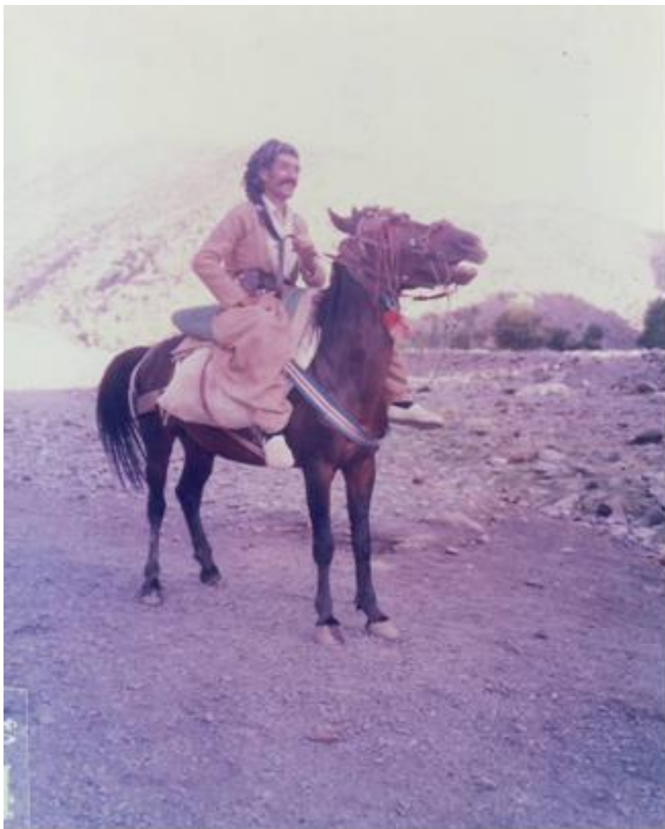
وینہی ژماره ۱۵ : بانہ - چۆمی سارتکی - سالی ۱۳۶۴