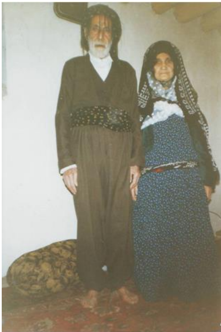
وینہی ژماره ۳۳ : باوکم ودايکم