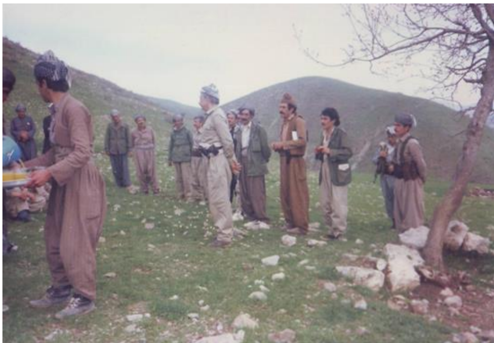
ژماره ۲۷ : ئاسایشگای گهره‌دی : سەردانی شەهید دوکتور قاسملوو ئە کادرو پێشمەرگەکانی هێزی ئاربابا - خاکەڵێوەی ۱۳۶۵ ی هەتاوی