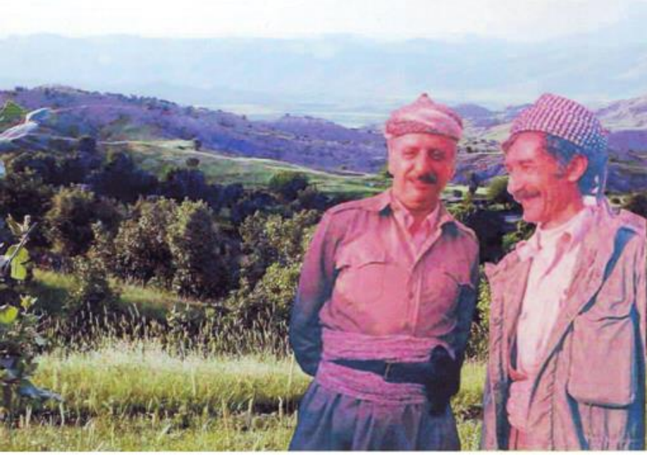
وینہی ژماره ۵ : له راستهوه : نهحمهدی قادی — شههید دوکتور قاسملوو دیاره نهر وینه هی نهوکات نیه .