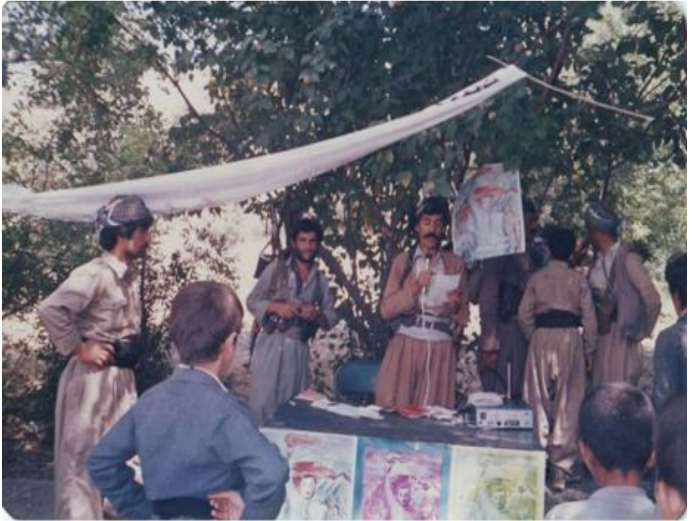
ژماره ۱۸ : جیژنی ۲۵ ی گه لاونیژی ۱۳۶۴ ی همتاوی - ناوچهی بانه - گوندی میوهکاژاو - بهر یوه بهری بهر نامه ی جیژنه که بووم .