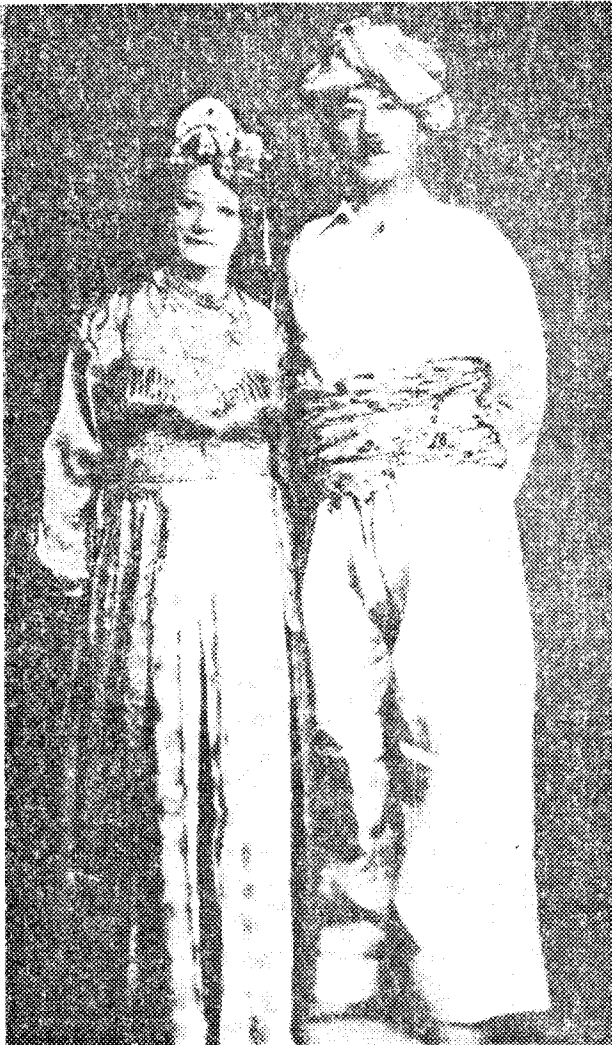
نبيحسان نوري پاشا له گهڼ څيزونه كهي