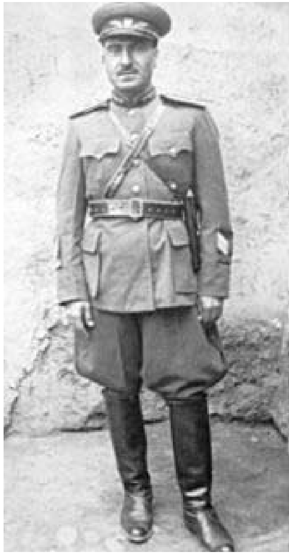
ژينيرال بارزاني نيمر